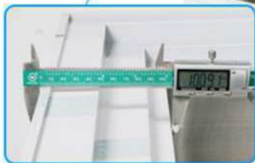
PANEL TERMICO DE 10cm