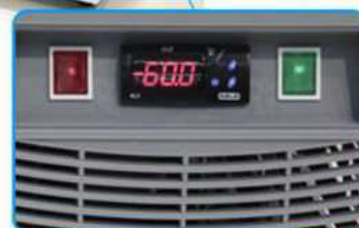
CONTROL DE TEMPERATURA EN TIEMPO REAL