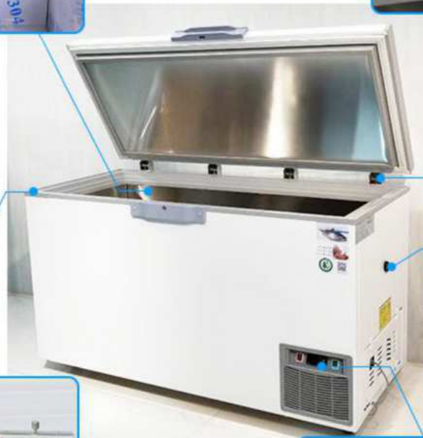
TOMA DE AIRE DE FACIL APERTURA